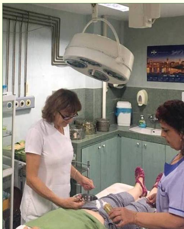
В Отделението по хирургия на МБАЛ "Хигия".