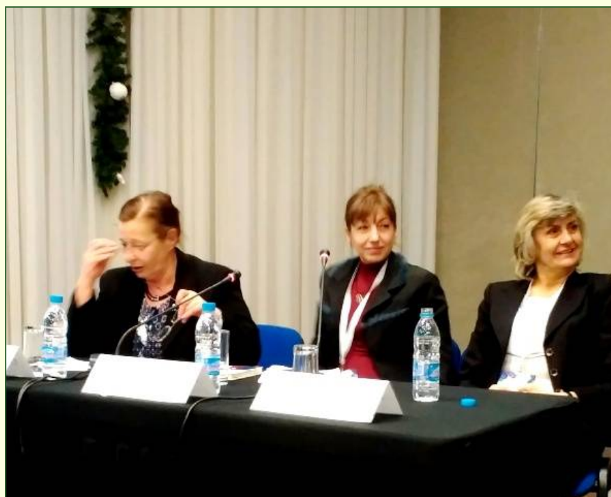
По време на Национална конференция на MedicRON (Rheumatology, Oncology and Neurology Conference).

- Работата ми започва в 7 часа на чашка кафе с колеги, преди началото на работния ден. След това няма време! Задълженията и отговорностите не са никак малко. Но това го знаят всички, които са на тази длъжност. Главната сестра е връзката между ръководството на лечебното заведение и останалия персонал, трябва да може да се справя с конфликтни ситуации, да работи в екип. Краят на работното време не оз-